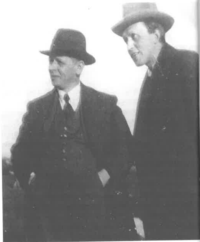
F. Šrámek a K. Čapek

Fráňa Šrámek patřil spolu s Františkem Langrem k prvním pátečníkům. „Pátky u Pisatele vznikly tak, že se u něho ve čtvrtek odpoledne začalo scházet pár spisovatelů; nejdřív to byl Franci Langer a Fráňa Šrámek, později přibyl Peroutka, Vančura a jiní, jak kdo koho vzal s sebou. Asi proto, že se tam při černé kávě dobře a volně povíдалo, přibývalo pravidelných hostů; byli to žurnalisté, malíři, univerzitní kantoři, doktoři – pestrá společnost...“ (Karel Čapek: Čtení o TGM. Melantrich, Praha 1969, s. 16-17). Jak hostů přibývalo, omezoval Šrámek svou účast a chodíval pak občas s Čapkem na procházky v kruhu nejužším. Známa je i Čapkova návštěva u Fráni Šrámka v Sobotce v červenci 1925. Na Čapka Šrámek nezanevřel, jak se někdy tvrdí. To dokládají jak výše uvedené verše, tak potom stejně označená báseň, zařazená do sbírky Rány, růže. V té čteme, že mu zůstalo po Čapkovi „obludné prázdno“: „To nikdo si nepovším a nikdo z nás,/ že skulinou zpod dveří protáhl mráz,/ tenounký had,/ že zvolna se sunul, klikatil vpřed,/ a z místa, kde v kotouč se svinul,/ vzápětí zelo a zelo/ obludným prázdňem.“