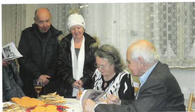
Křest knihy Sobotecká lékárna – autogramiáda autorů O. Bičištové a K. Bílka