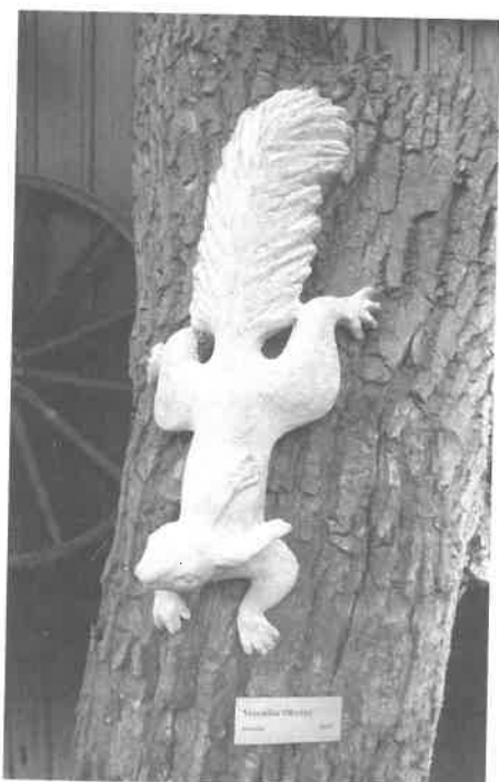
Ak. sochařka Veronika Oleríny – Veverka (2015)

Za nejvýznamnější událost sezony považuji potěšující skutečnost, že se po několikaleté a dle mého názoru bezdůvodné přestávce na Šolcův statek navrátily pořady Šrámkovy Sobotky. Proto se tu během festivalu uskutečnily hned 4 a málem 5 akcí: 30. červ-