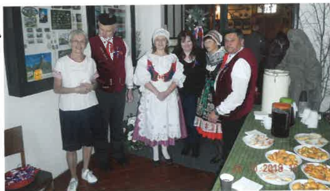
Zámek Humprecht – koncert k výročí 100 let republiky