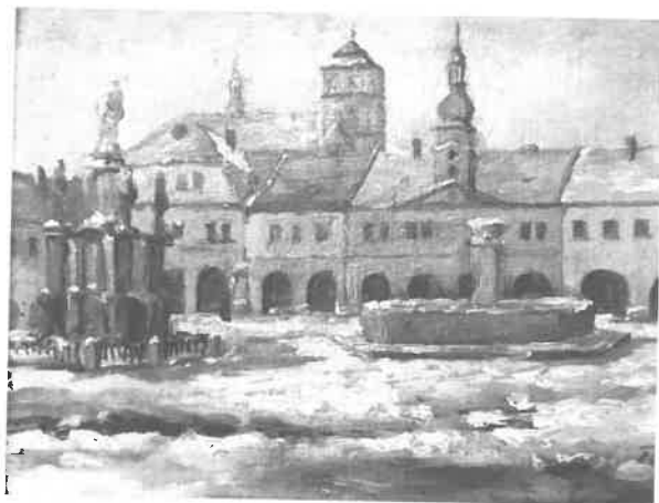
Zimní náměstí v Sobotce – J. Fejfar

Ve snaze uvést cello do přesně „předúrazového“ stavu rozhodl se otec bodec slepit. Za jediné záračně spolehlivé lepidlo jako příslušník „staré školy“ považoval klíh. Ulomenou část bodce ke zbytku přiklížil. Všechno bylo v pořádku až asi do druhé zkoušky. Při ní došlo k situaci, kdy byl slep vystaven (ne mou vinou) zvýšené námaze. Ukázalo se, že klíh není tak všemocné lepidlo, jak jsme předpokládali. Prostě bodec se ve stejném místě od těla nástroje zase oddělil. Opět mě přepadl obrovský