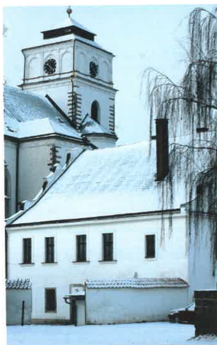
Zima v Sobotce