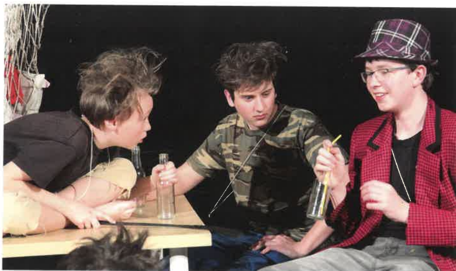
Studio Šrámkova domu – představení My, vrabčáci