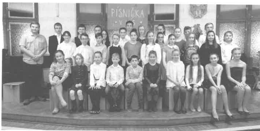
Žáci ZUŠ Sobotka – koncert k výročí 100 let republiky

Plány na nový nástroj do katedrály sv. Víta spřádané od 20. let, byly velkolepé. Nástroj se měl stát ozdobou chrámu a dokonce i největším chrámovým nástrojem na světě. Velká očekávání však nemohla být naplněna, neboť nákladná dostavba chrámu a pořízení nezbytného vybavení interiéru katedrály vyčerpaly možnosti stavebníků. Bylo proto po delších jednáních rozhodnuto poříditi skromnější provizorní nástroj a postavení velkých varhan svěřit budoucím generacím. Varhany pak postavila v r. 1932 kutnohorská varhanářská firma Josefa Melzera. Myšlenka postavení nových varhan však nezanikla, ale opakovaně se vynořovala, aby byla v důsledku nepříznivých celospolečenských událostí let válečných i v důsledku poválečného ušpořádání odložena na časy příznivější. V současnosti slouží ve svatovítské katedrále k doprovodu bohoslužeb, ale