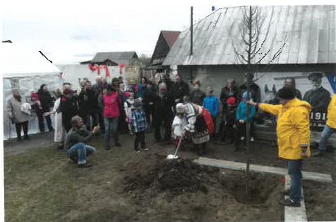
Sázení Lípy svobody v Čálovicích