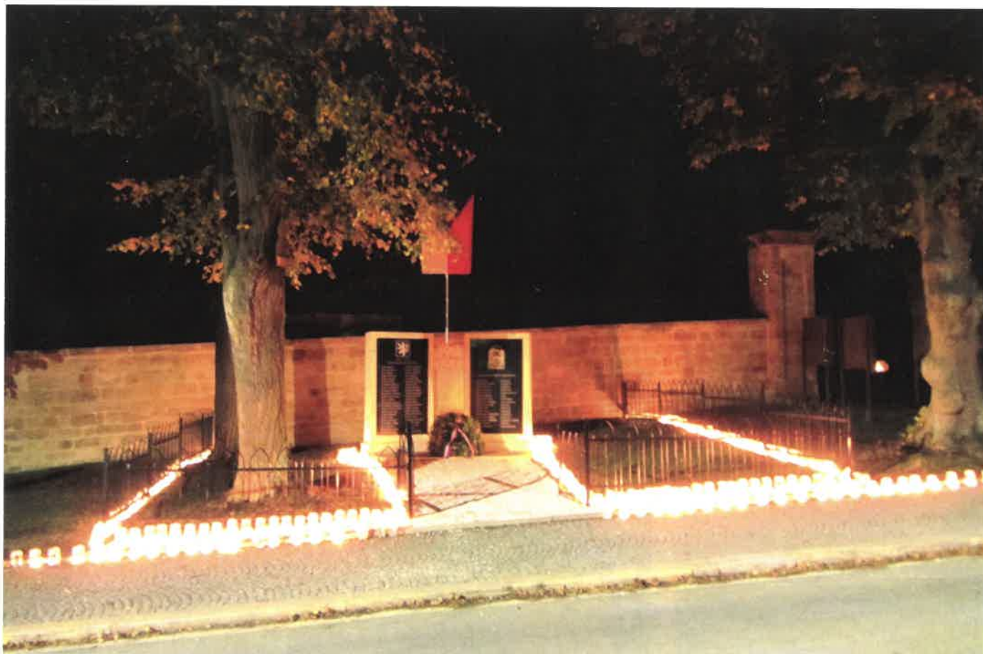
Pomník obětí I. světové války v Sobotce