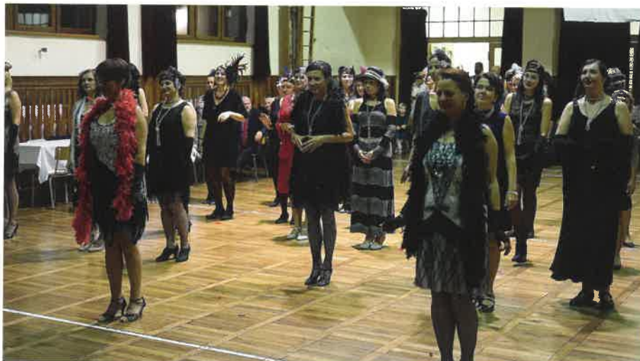
Společenský večer – výuka prvorepublikového tance