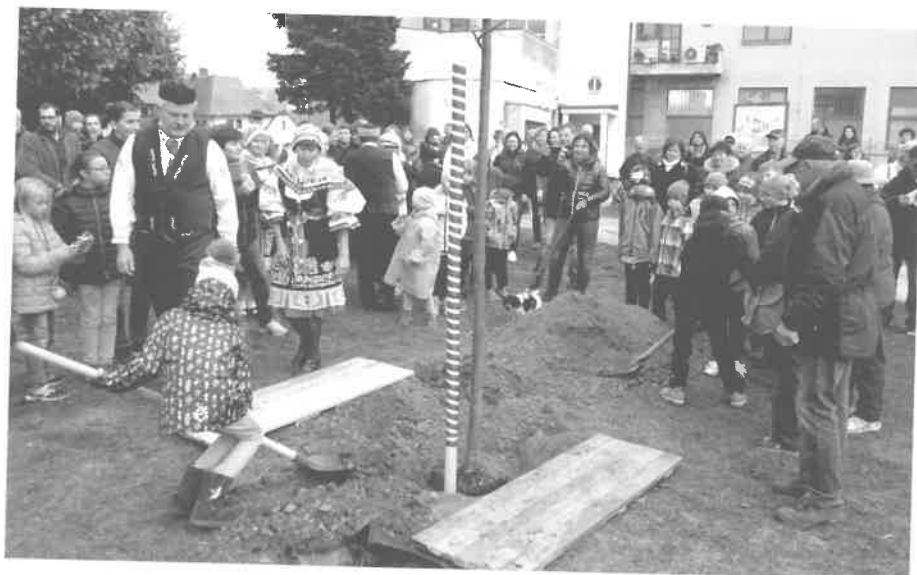
Sázení Lípy svobody v Sobotce – foto: L. Jenček ml.

Podzimní oslavy 100. výročí vzniku republiky se odehrály i v lehčím duchu – v pátek 19. 10. byl v sokolovně uspořádán Společenský večer ve stylu první republiky, na kterém zahrál Orchestr Jindřicha Bady. Stylové kostýmy, ná-