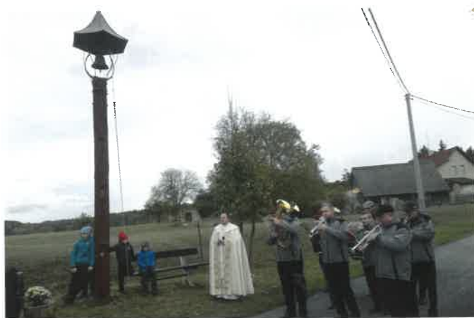
Svěcení zvoničky v Čálovicích