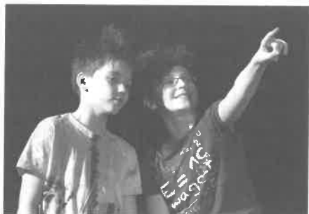
Představení – My, vrabčáci

nimi! Tedy z 500 souborů být mezi 16 nejlepšími je velký úspěch. Již několik let po sobě SŠD skončilo na pomyslné stříbrné metě, tedy mezi doporučenými, které se z kapacitních či jiných důvodů na přehlídku nedostaly.