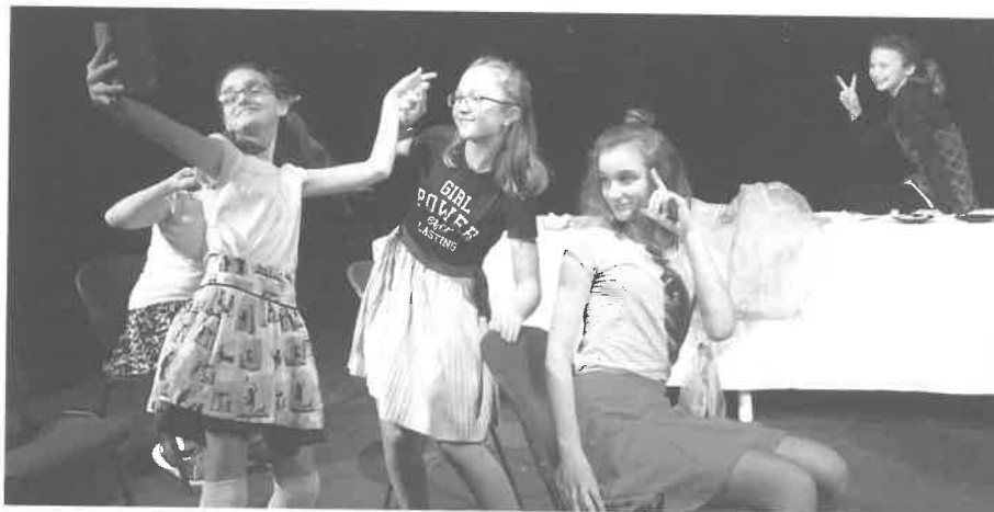
Studio Šrámkova Domu – představení – Čekání na paní učitelku Godotovou

ručení ještě neznamená účast, jelikož kapacity jsou omezené a na celostátní kolo do Svitav jedou jen ti nejlepší. Programová rada vybrala nakonec k účasti souborů 16. A sobotecký byl letos mezi